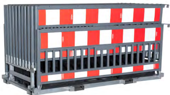
Die Kombipalette KPA 22M L

Die ideale Materialschonung und die schnellste Transportmöglichkeit, da die Fußplatten K1 sicher u. griffgünstig unter den Absturzsicherungen liegen.