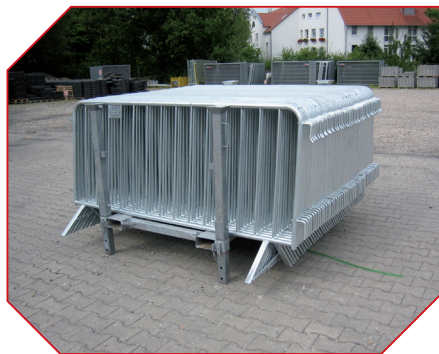
46 BFAG.net® Gitter auf der STG 35 Palette