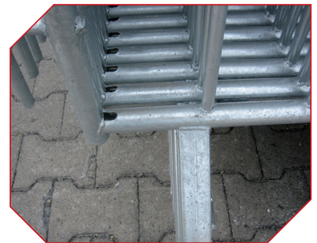
Vollfeuerverzinkte Gitter (Zinkbohrungen)