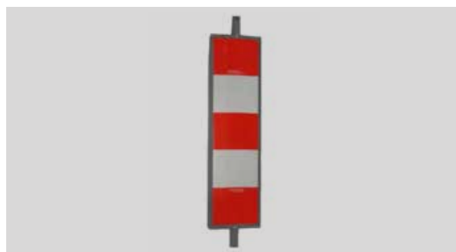
Schrägbake gerade Schweden/Norwegen