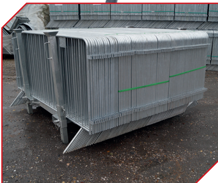
BFAG.net® Stahlgitter eng zusammengesetzt