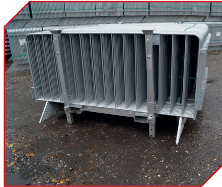
85 BFAG.net® Gitter LIGHT auf der STG 35 Palette