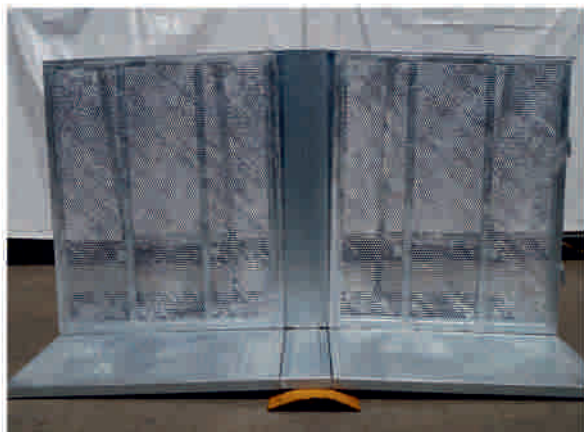
Neigung von 0 bis 5 % = 5 cm je Meter

Mit dem Bühnengitter Neigungspositionierer bleibt Ihnen beim Aufbau jede Hürde erspart. Dank dem Neigungsausgleich sind Sie für jede Unebenheit auf der Straße oder Wiese bestens vorbereitet. Durch die große Flexibilität sind Neigungen bis zu 8% mühelos zu überwinden. Für jedes Gefälle bergauf oder bergab.